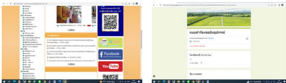
ภาพประกอบ