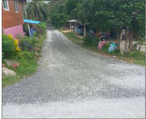
๙. ปรับปรุงถนนสายหารอ้ายฝั่งตะวันออก งบประมาณที่เบิกจ่าย ๑๒,๗๕๐ บาท