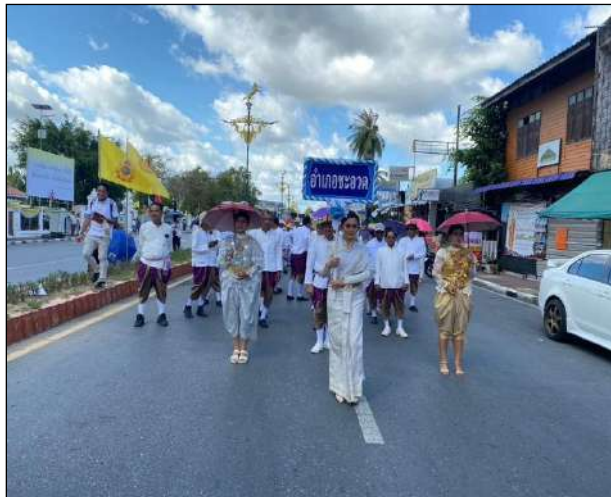
๔. โครงการสืบสานประเพณีชักพระ งบประมาณที่เบิกจ่าย ๒๔,๙๕๐ บาท