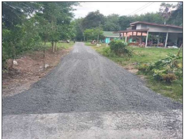
๑๐. ปรับปรุงถนนสายหารอ้ายฝั่งตะวันตก งบประมาณที่เบิกจ่าย ๑๒,๗๕๐ บาท